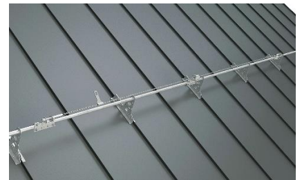
Takräcke med vajersystem